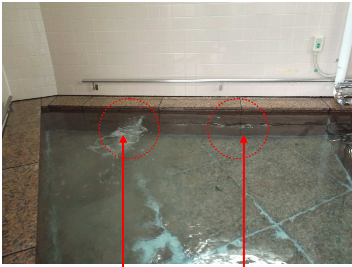
ジェットの出が悪い 全く出ない