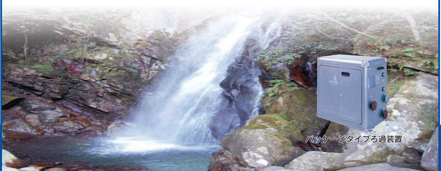
パッケージタイプろ過装置