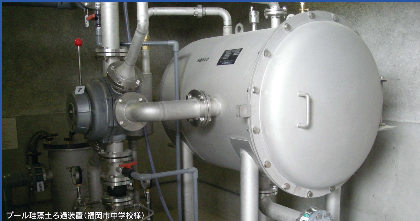
プール珪藻土ろ過装置(福岡市中学校様)

弊社の製品は、お客様の用途に合わせ受注生産致しております。 プール・浴槽・池など用途に合わせ『設計・施工・販売』を行なっております。 ろ過タンクは、水質に合わせ鉄製・FRP製・ステンレス製があります。 井戸水の使用は勿論、温泉水・海水仕様にも対応可能です。