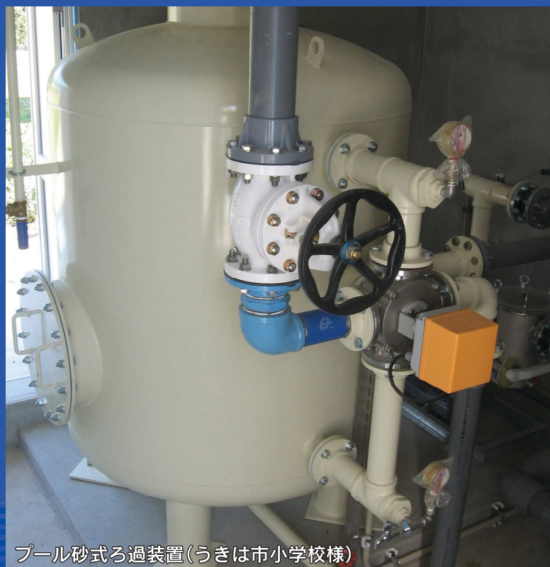
プール砂式ろ過装置(うきは市小学校様)