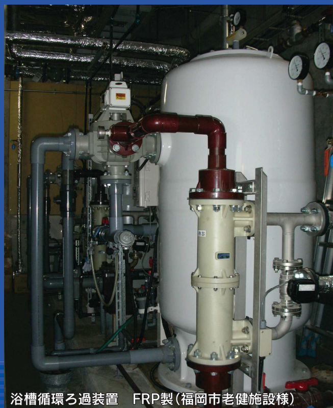
浴槽循環ろ過装置 FRP製(福岡市老健施設様)